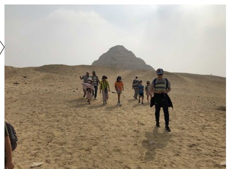
砂漠ハイキング （サッカー）