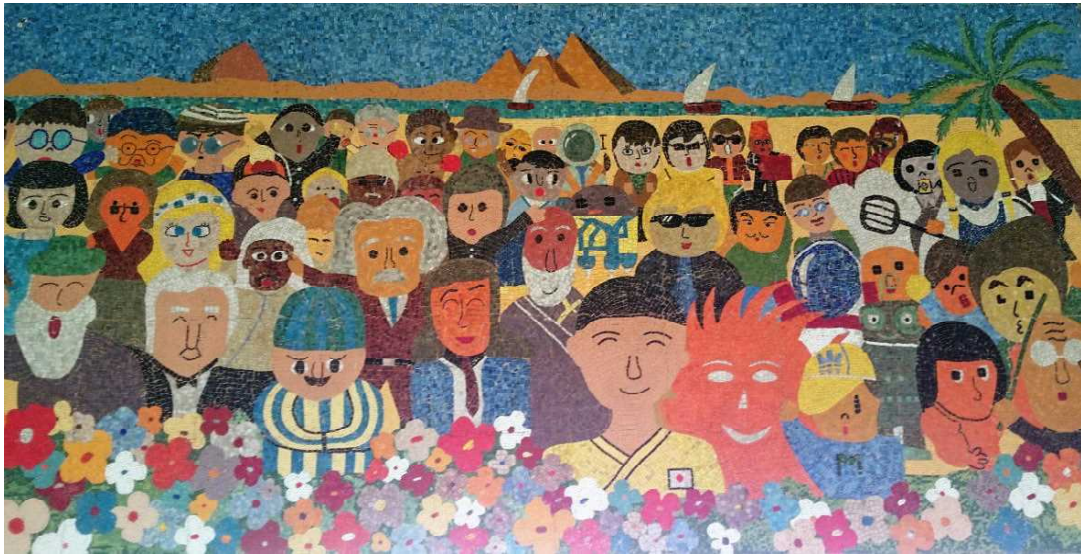
玄関ホールのモザイク壁画