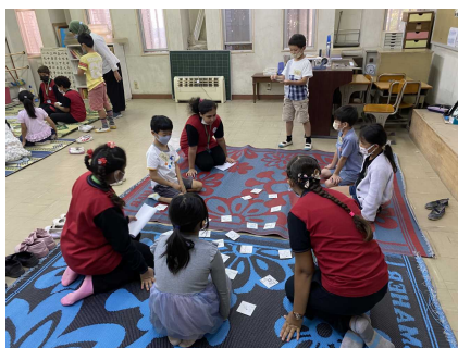
ジャパンデー（交流校の 学生と日本文化の発信）