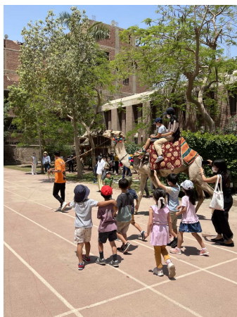
ピラミッド学習 （校庭でラクダに乗る体験）