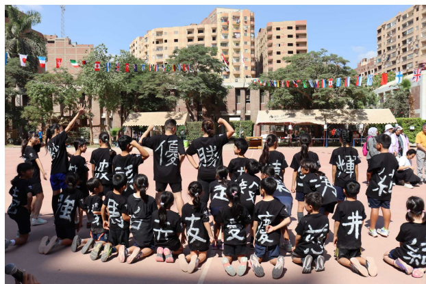
運動会（日本人会と合同で 多彩なプログラム）